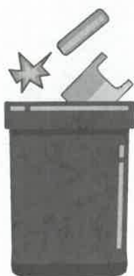
SACCO NERO rifiuti indifferenziati

I SACCHI DEPOSITATI PER LA RACCOLTA DEVONO RISPETTARE IL COLORE IN BASE ALLA TIPOLOGIA DI RIFIUTO CONTENUTO (i sacchi sono distribuiti gratuitamente presso gli Uffici comunali)