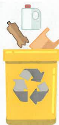
SACCO GIALLO plastica e lattine