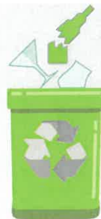
VETRO raccolto porta a porta il 1° martedì di ogni mese